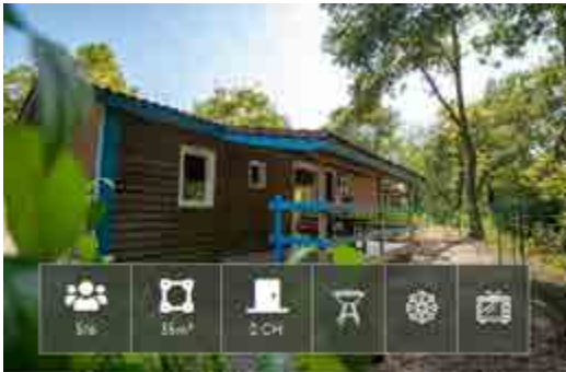
Chalet - Grand Confort 5 à 6 pers.