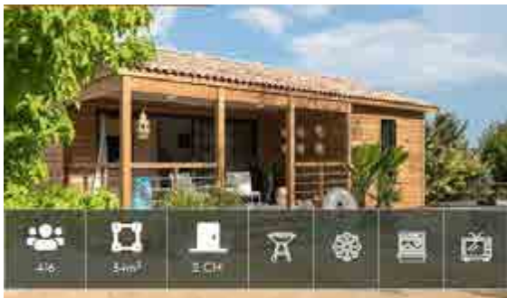
Chalet Premium - 4 à 6 pers.