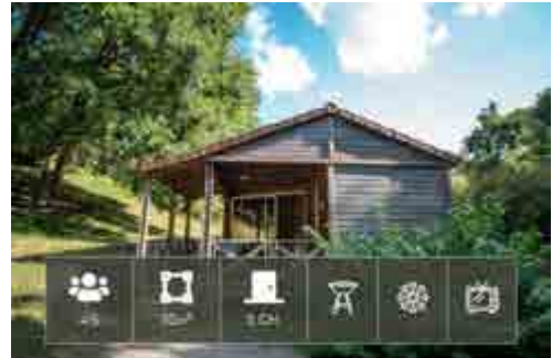
Chalet - Grand Confort 4 à 5 pers