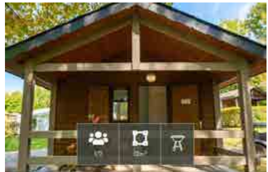
Chalet Classique - Le confort à Petit prix 1 à 2 pers.